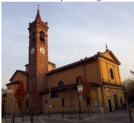
La Chiesa dei SS. Nazaro e Celso

“la chiesa assai capace ed elegante è dedicata ai SS. Martiri Nazaro e Celso e misura 36 cubiti di lunghezza (15 metri) e 26 di larghezza (10 metri circa). La nave della chiesa è coperta da un tavolato, il coro da una volta. Contiene due altari: il maggiore nel cui tabernacolo di legno dorato ed ornato di piccole colonne si conserva il SS. Sacramento; l'altro invece è dedicato alla Madonna e situato dal lato del Vangelo”.