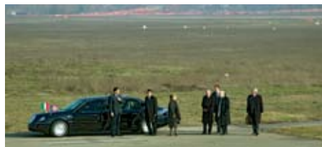
Il Presidente Ciampi all'aeroporto di Bresso