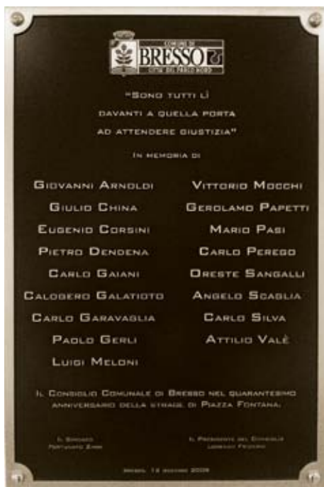
La targa all'ingresso dell'Aula Consiliare

Il 27 settembre 2011 il Presidente della Regione Lombardia, il Presidente della Provincia di Milano, il Sindaco di Milano e il Presidente della Fondazione Milano Famiglie 2012, in una conferenza stampa, annunciano la presenza di Papa Benedetto XVI al Parco Nord-Aeroporto di Bresso il 2 giugno 2012 per la Festa delle testimonianze ed il 3 giugno 2012 per la S. Messa, l'Omelia e l'Angelus.