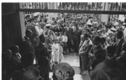
Inaugurazione della scuola di via Lurani