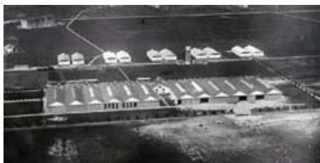
veduta dell'area industriale Breda

grazie alla spinta delle imprese aviatorie che si susseguono in quegli anni e alla campagna propagandistica del fascismo. La pista di collaudo situata nel territorio di Cinisello al confine con Sesto San Giovanni, è poco disturbata dalle nebbie ed è caratterizzata da una buona permeabilità del suolo, tale da consentire il lancio e l'atterraggio anche durante la stagione piovosa. Per integrare e rendere più efficace l'attività aeronautica, la Breda crea una scuola aviatori per piloti civili e militari, accordando brevetti di primo, secondo e terzo grado ed impartendo istruzione di volo strumentale ed acrobatico. E' proprio di quegli anni, nel 1924, la discussa impresa di Umberto Nobile al Polo Nord. Alla realizzazione del dirigibile Italia concorrono anche tecnici degli stabilimenti Breda di Sesto San Giovanni e Bresso. E un italiano, l'Ing. Bellanca della Breda Aeronautica, che disegna e costruisce lo Spirit of St. Louis, il