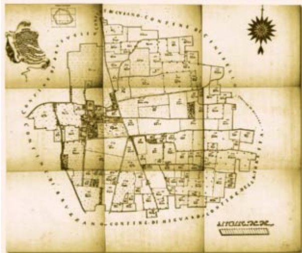
Mappa del territorio dal censimento catastale del 1721

d'Asburgo ad imperatore del Sacro Romano Impero: al governo di Vienna sono riconosciuti e territori spagnoli in Italia ed iniziano 147 anni di dominazione austriaca nel milanese. Bresso viene coinvolta dal passaggio dei soldati durante la guerra di Successione Polacca scoppiata nel 1733. Alla morte di Carlo VI nel 1736 e dopo alterne vicende la pace di Aquisgrana del 1748 riconosce a Maria Teresa il titolo di imperatrice ed inizia un periodo di riforme e prosperità per tutta la Lombardia. In questo contesto si inserisce il più antico documento toponomastico del comune di Bresso: la mappa del territorio tracciata in occasione del censimento catastale del 1721.