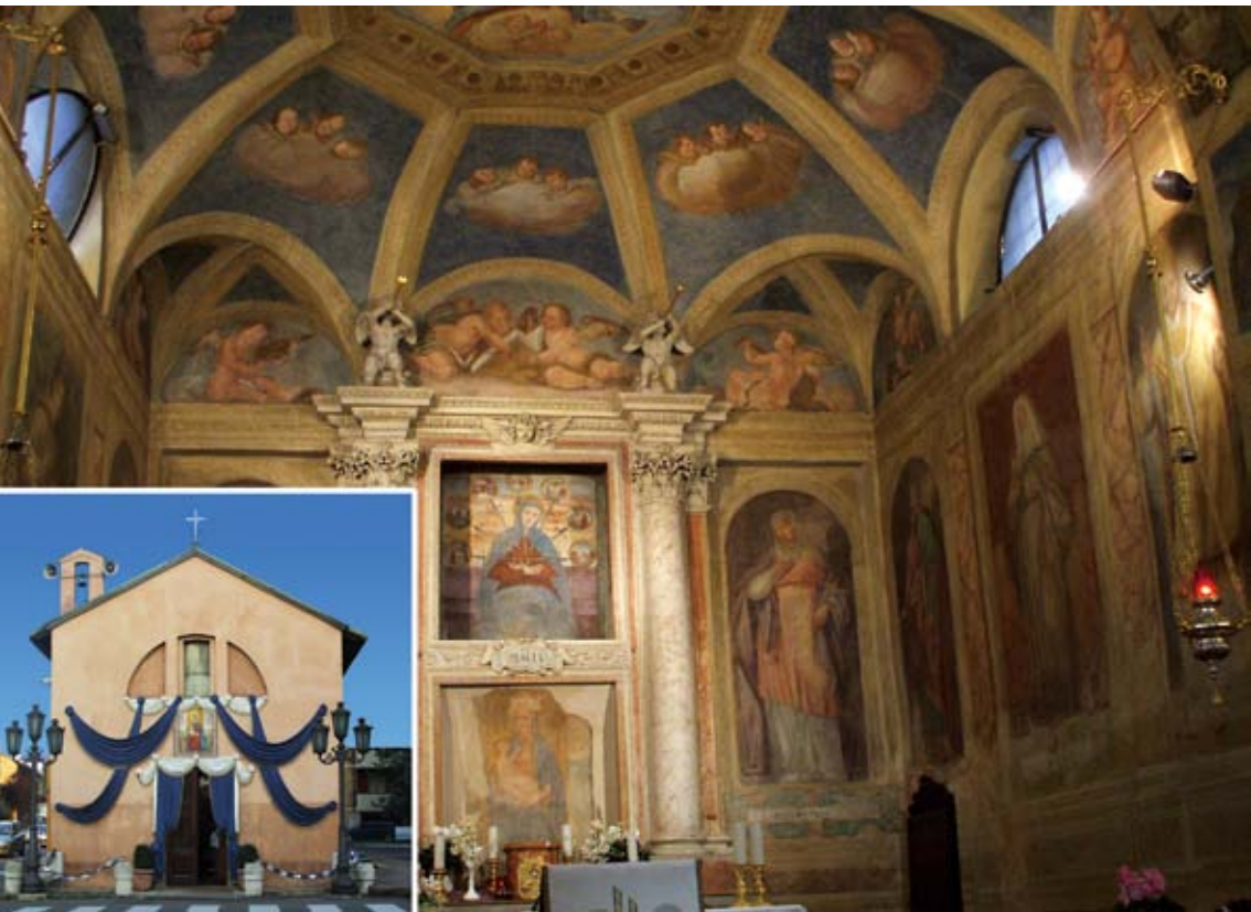
Oratorio della Beata Vergine delle Grazie detto "il Pilastrello"

non doveva essere molto diversa dall'edificio descritto dal delegato arcivescovile Francesco Cermenati nel 1567: a navata unica, privo di cappelle, con la facciata a capanna, in mattoni a vista, affiancata dal campanile, dall'ossario e dalla casa parrocchiale. Il campanile subisce un crollo e viene distrutto alla fine del cinquecento. Viene ricostruito nel 1611 e ulteriormente modificato in epoca recente.