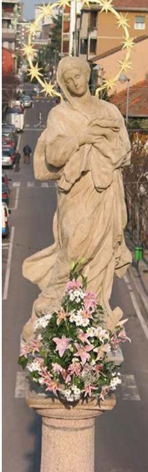
La statua della Madonna Immacolata dopo il restauro

Nell'anno 2000 viene istituita la Benemerenzza Civica "Castela d'Oro", rendendo omaggio alla statua della Madonna Immacolata considerata dai cittadini bressesi il "monumento di Bresso" e detta, appunto, Castela. Citando testualmente lo scultore Francesco Lesma (da A. Radaelli - F. Zinni, La Castela , Comune di Bresso, 2003): "La Castela fu scolpita da mani ignote in pietra arenaria intorno alla prima metà del XVII secolo. ... I "vecchi" la chiamavano Madonna della Neve e la consideravano una protezione contro le avversità atmosferiche e le carestie. ... L'etimologia della parola "Castela" deriva da "castellana", termine usato anticamente per identificare la signora, o patrona, di un determinato luogo e, casualmente, le origini della statua