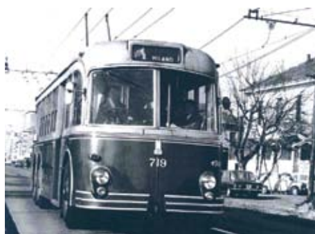
Il filobus n. 83 Bresso-Stazione Centrale FS