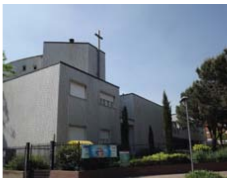
Chiesa di San Carlo