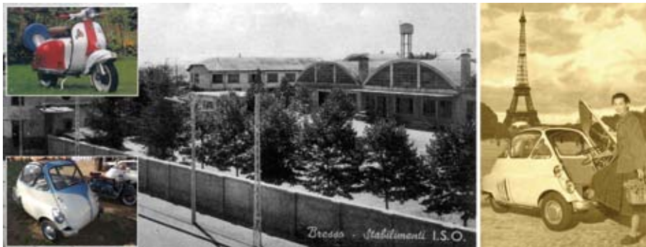
(alto sin.) Iso Diva (basso sin.) Isetta al Parco Rivolta - Lo stabilimento della ISO - Isetta a Parigi