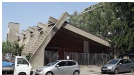
Chiesa di San Francesco