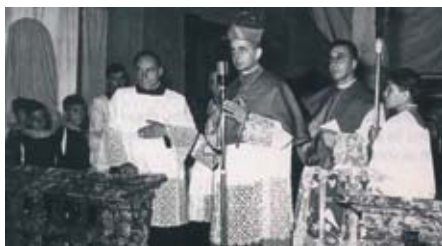
Papa Paolo VI in S.S. Nazaro e Celso