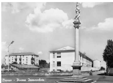
Il complesso di via Lurani