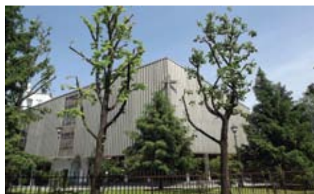
Chiesa della Madonna della Misericordia