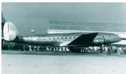
Aeroporto di Bresso: quadrimotore BZ 308

Nel 1939 entra in funzione il primo Ufficio Postale di Bresso. Nel 1940 l'Italia entra in guerra: iniziano i lutti per le famiglie bressesesi e i bombardamenti sulle città. La gente comincia a sfollare presso amici e parenti in Brianza o nel Varesotto. Nel 1943 crolla il fascismo: Milano viene bombardata a tappeto dagli anglo-americani fino all'armistizio, per accelerare la resa degli italiani. L'8 settembre inizia l'occupazione tedesca e la guerra civile. Anche a Bresso si costituisce il CLN clandestino: ne fanno parte personaggi che avranno poi responsabilità nella amministrazione della città dopo la liberazione. Bresso subisce un primo bombardamento all'inizio della primavera del 1944. Il 30 Aprile 1944 apparecchi americani sganciano bombe sullo stabilimento Breda-Campovolo e tutti i capannoni vengono rasi al suolo.