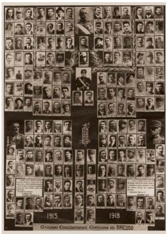
Composizione fotografica dei combattenti bressesi della Prima Guerra Mondiale

Il 24 Maggio 1915 l'Italia entra in guerra contro Austria e Germania. Seicento bressesi vi prendono parte: dalla classe 1874 a quella 1900. Nel 1924 viene innalzato davanti al municipio di Via Vittorio Emanuele (attuale via Centurelli) un monumento in memoria dei caduti della grande guerra ed è inaugurato il viale delle Rimembranze. L'ultima seduta del Consiglio Comunale di Bresso prima della dittatura fascista avviene il 22 maggio 1926. Da questa data, per tutto il ventennio, Bresso verrà retta da podestà o commissari prefettizi nominati dal regime.