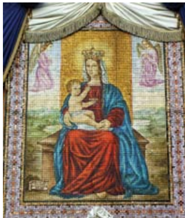
Mosaico sulla facciata dell'Oratorio della Madonna del Pilastrello