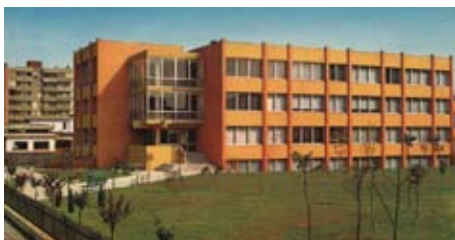
Scuola elementare Don Sturzo