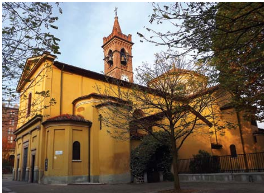
La Parrocchiale dei SS. Nazaro e Celso