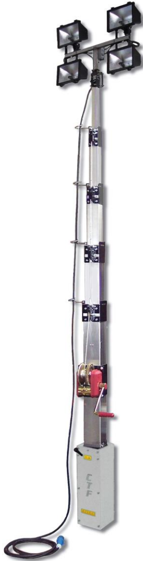
MODEL C.E.B. 9CTF